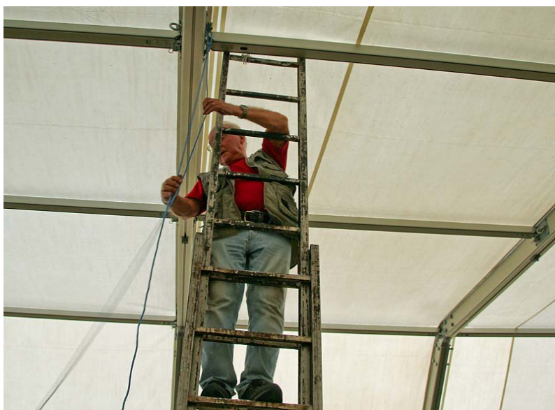
Noen bygget høyere enn oss andre.