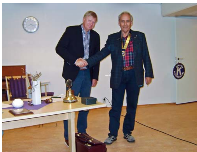
Og dette er HOLF