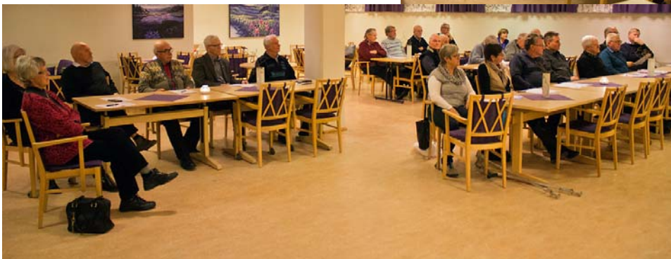
19. januar 2016. Et nytt trekk: Divisjonsmøte kombinert med medlemsmøte; spennende å høre hva medlemmene som deltok syntes om det!

Neste divisjonsmøte blir på Kongsvinger 18. april.